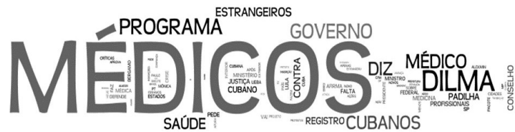
Figura 2 - Nuvem de palavras dos títulos das notícias sobre o Programa Mais Médicos analisadas. Brasil 2013-2014