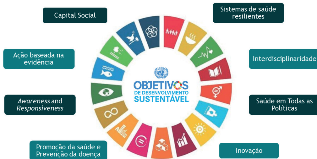
Figura 2: Soluções e Oportunidades da Saúde Pública no Século XXI e os Objetivos de Desenvolvimento Sustentável da Organização das Nações Unidas

luções eficientes, inovadoras e criativas para os problemas de saúde do futuro.